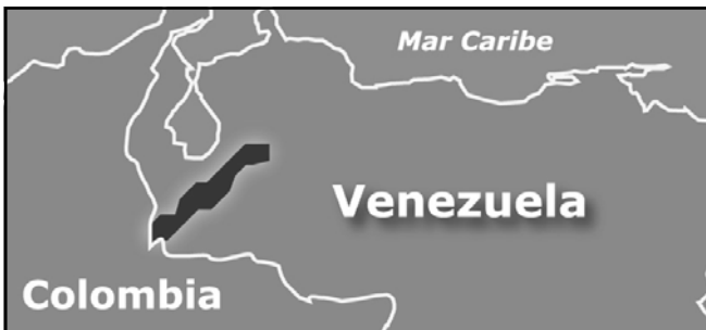
■ Distribución del pato de torrentes en Venezuela

Habita únicamente en los caudalosos ríos de montaña y está totalmente adaptado a vivir en ellos.