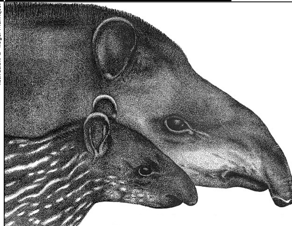
Ilustración: © Roger Manrique.