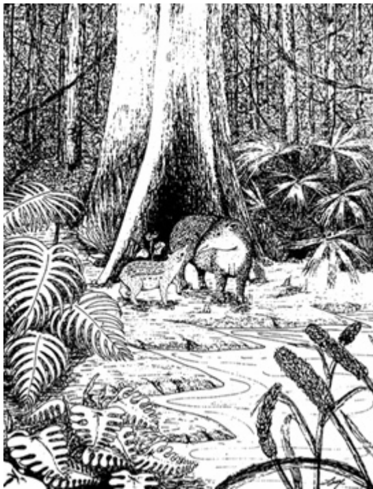
Ilustración: © Evaristo Ríos Levy

En las selvas del piedemonte de la Cordillera Andina, las dantas ya han desaparecido prácticamente y ahora también es muy raro verlas en las selvas de la Cordillera de la Costa.