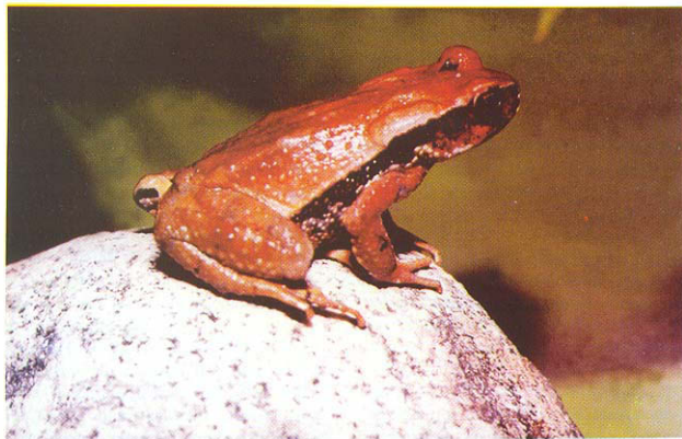
Figura 1. Bufo glaberrimus Günther, 1869 "1868" en vivo, CVULA IV5803